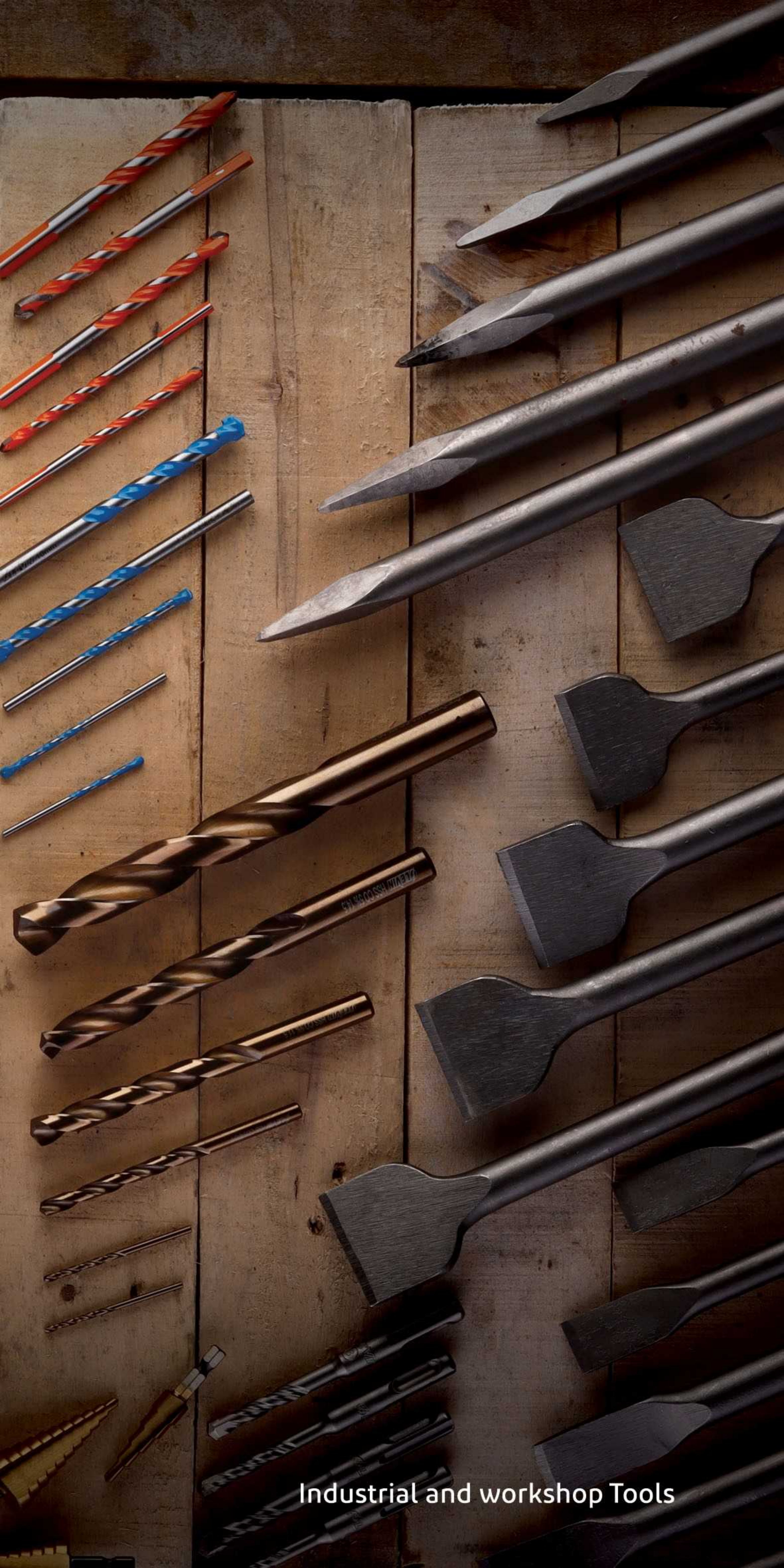
Industrial and workshop Tools